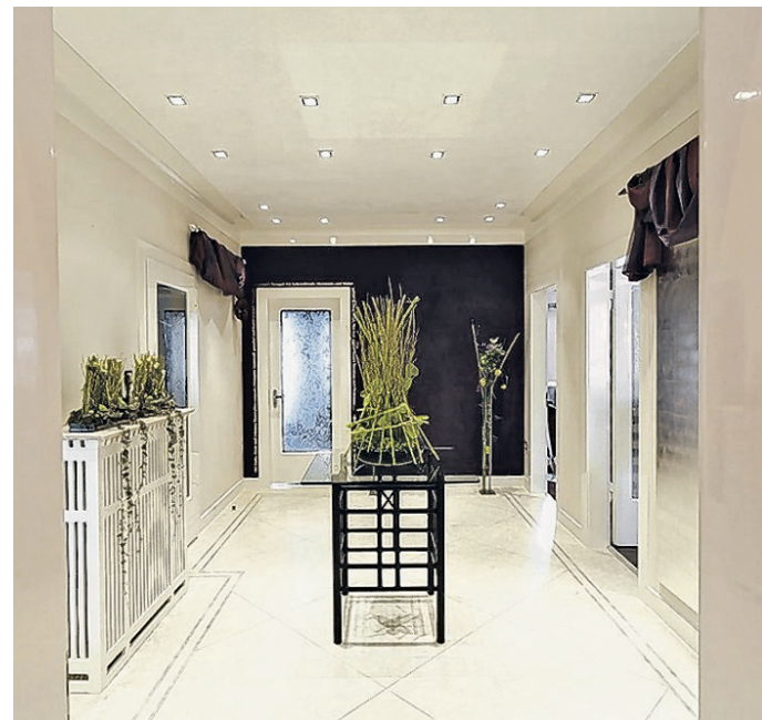
Doeges Konzept: Maler sind keine Anstreicher, sondern Raumgestalter – man sieht's.

Der neueste Clou: Farben des britischen Herstellers Farrow & Ball. „Zu unserem sehr umfangreichen Angebot kommt diese Premium-Farbe hinzu. Wir bieten sie als einziger Betrieb im Kreis Mettmann in 132 ausgewählten Farbtö-